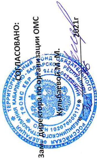
ГРАФИК дежурств представителей Кабардино-Балкарского филиала ООО «СМК РЕСО-Мед» в медицинских организациях КБР на «Посту качества» с 09-00 до 12-00 час в июль 2021 года